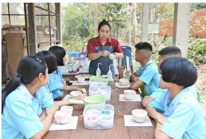
ภาพที่ 2.5 แสดงการสอนงานปั้นเซรามิก ของฐานการเรียนรู้ปั้นเสริมเติมแต่ง ณ โรงเรียนน่านปัญญานุกูล จังหวัดน่าน

อย่างไรก็ตาม สำหรับคนที่มีความบกพร่องทางสติปัญญา การรับรู้ หรือความทรงจำอย่างรุนแรง การสอนงาน โดยลองผิดลองถูก อาจมีความเสี่ยงในการทำให้สับสนได้ เนื่องจากอาจรู้สึกตระหนักเวลาที่ถูกระบุว่าทำผิด และพอลองผิดลองถูกหลายครั้งก็อาจทำให้จำไม่ได้ว่าวิธีไหนคือวิธีที่ถูกต้อง คนที่เหมาะสมกับการสอนงาน โดยลองผิดลองถูก มี 2 องค์ประกอบคือ (1) สามารถจำได้ว่าวิธีไหนคือวิธีที่ถูกต้อง จากหลายๆวิธีที่ได้ลองปฏิบัติ (2) สามารถเข้าใจได้ว่าทำไมถึงผิด หรือไม่ถูกต้อง หากคนพิการมีความสามารถข้างต้นไม่เพียงพอ ก็ควรที่จะใช้เทคนิคการสอนงานให้เข้าใจง่าย เพื่อเรียนรู้วิธีการแบบเดียวให้สามารถปฏิบัติได้จริงจะดีกว่า