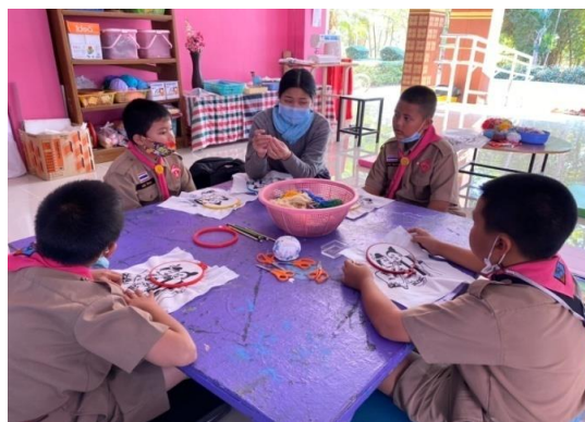
ภาพที่ 2.6 การสอนงานหัตถกรรมของนักเรียน

P (Physical Prompt): สามารถทำได้โดยการจับมือทำ