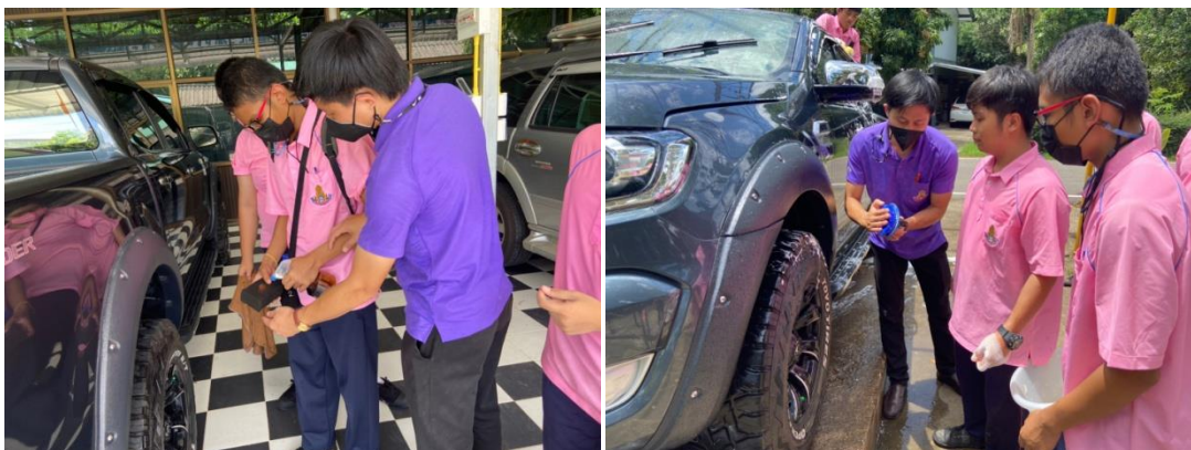
ภาพที่ 2.4 แสดงการใช้เทคนิคการสอนงานเพื่อให้นักเรียนเข้าใจง่าย โดยการจับมือทำ (Physical Prompts) และการแสดงท่าทางประกอบ (Gesture) ของฐานการเรียนรู้ เดอะสตาร์คาร์แคร์ ณ โรงเรียนน่านปัญญานุกูล จังหวัดน่าน